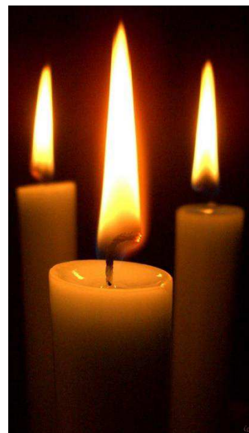
uit 'Even Stilstaan' (Chris Lindhout)

Maar zie, U bent er al Voor wij een stap gezet hebben.