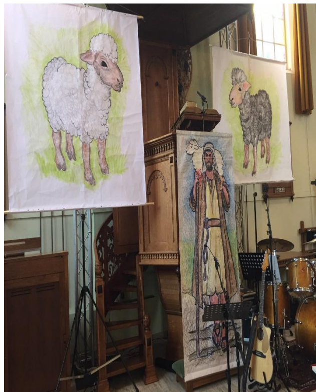
Prachtige tekeningen door meester Albert van F.

De God van vrede, geeft jou Zijn zegen Op alle wegen, die je zult gaan. Wanneer het meevalt, of soms ook tegen Bij zon en bij regen zal Hij naast je staan Hij is als een schaduw, die met je meegaat Jou nooit alleen laat, want Hij is trouw Ontvang nu de vrede en de genade Van onze God en Vader. Zo zegent Hij jou